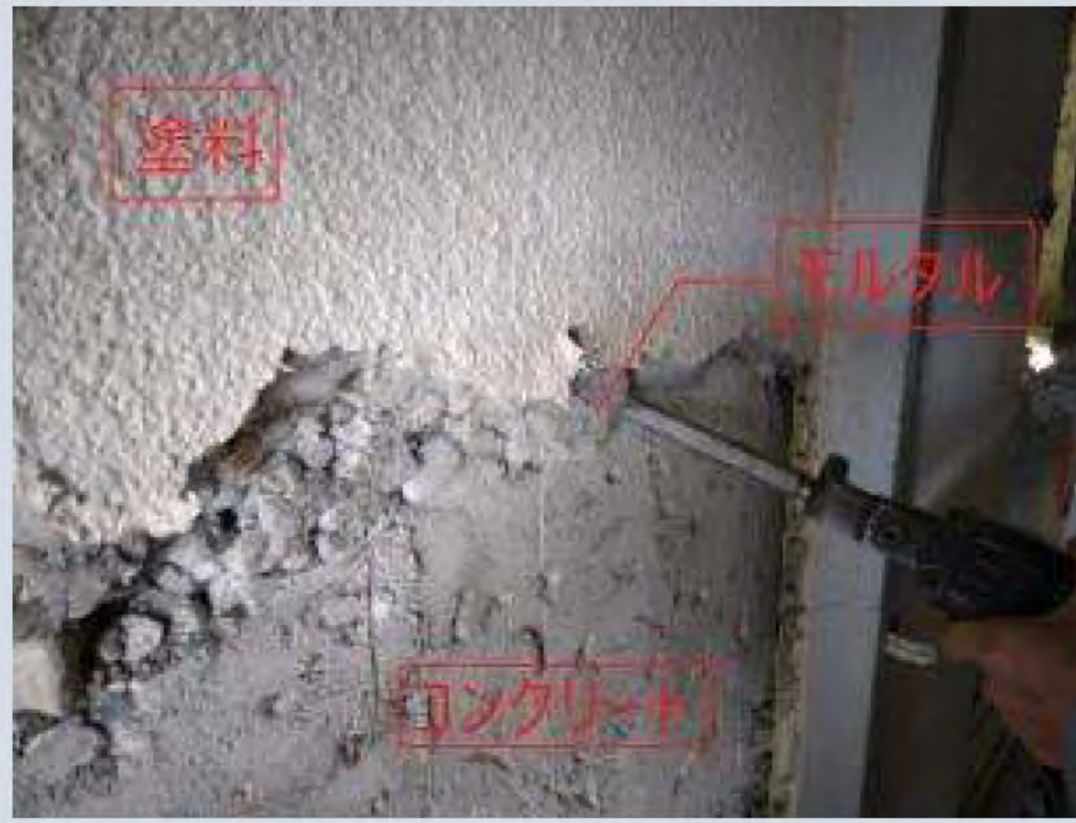
モルタル撤去中の壁