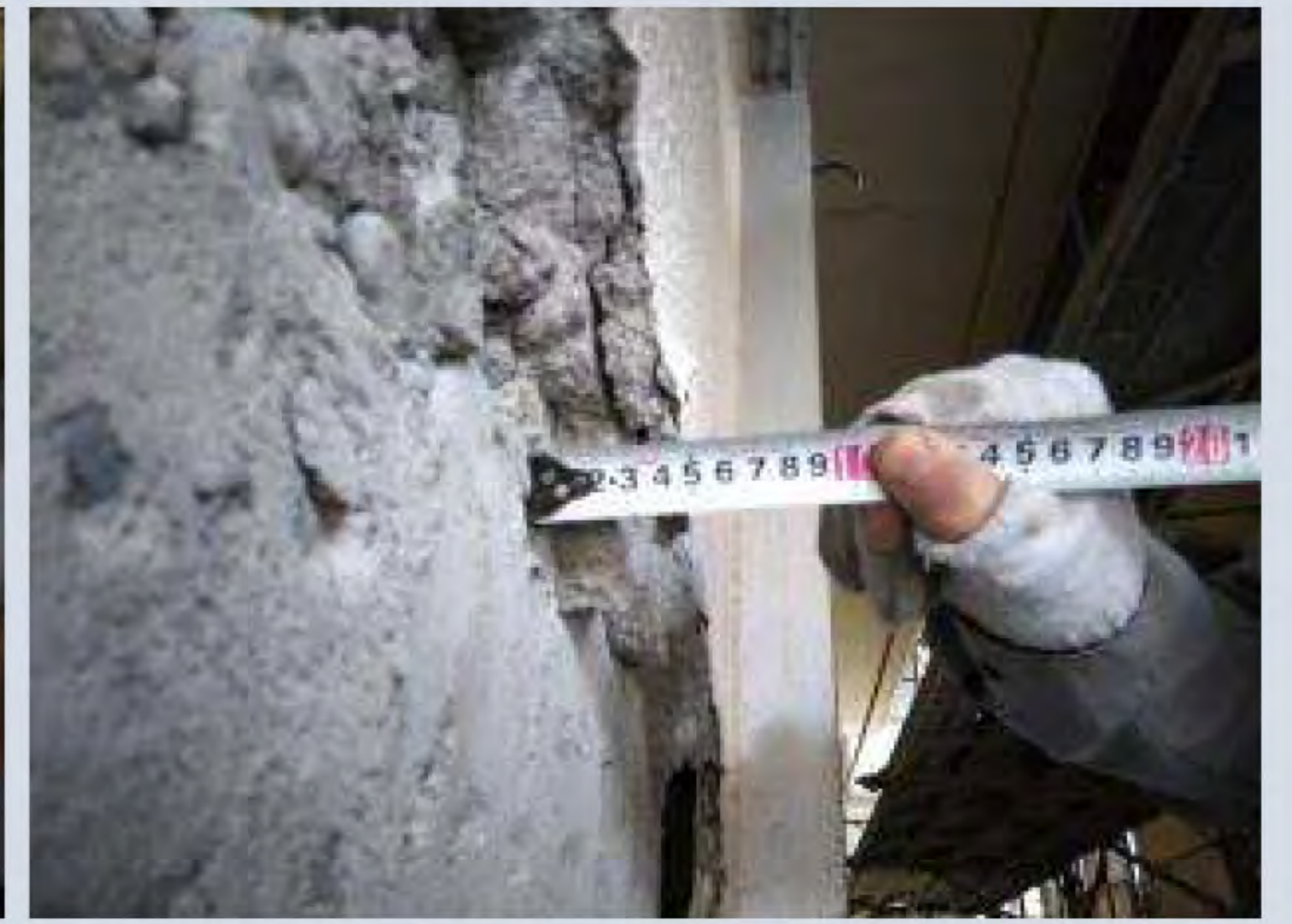
モルタル厚さ計測